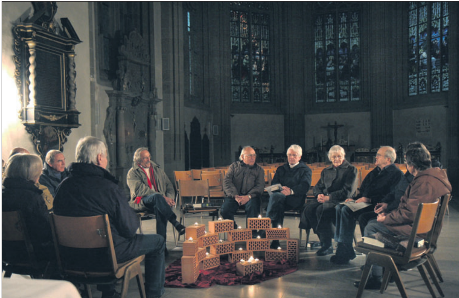
Jeden Montag beten sie in der Schorndorfer Stadtkirche für den Frieden – doch ein Christ, finden sie, sollte nicht nur Gebete sprechen, sondern mit seinem Handeln für die Überwindung der Gewalt eintreten.